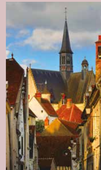
village de Montrésor et la collégiale St-Jean-Baptiste

Fondé par Henri II Plantagenêt en 1157 pour les Ermites de Grandmont, ce prieuré possède des bâtiments du XII e siècle : une partie de la nef de l'église (lieu de culte), les anciens bâtiments du dortoir et du réfectoire. Visite guidée de l'église, des extérieurs et l'ancienne cuisine monastique. De 14h30 à 19h - libre participation Tél. : 02 47 92 76 48