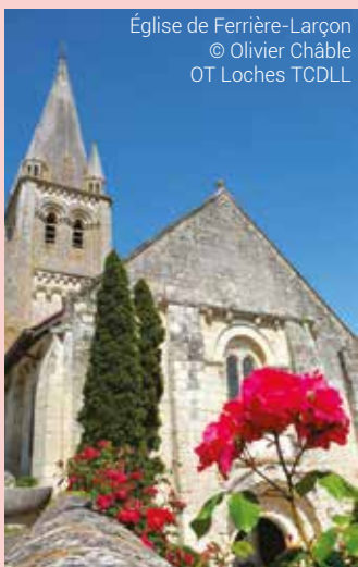
Église de Ferrière-Larçon

Visite du musée Minerve, classé « Musée de France », qui expose des vestiges gallo-romains, ainsi que le musée Mado Robin relatant la vie de la cantatrice à la voix la plus haute du monde. De 14h30 à 18h - gratuit Tél. : 02 47 94 26 54