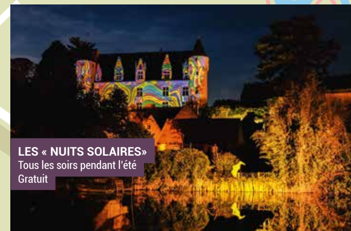
LES « NUITS SOLAIRES » Tous les soirs pendant l'été Gratuit

Opposite the Rue de l'Huissette which leads to the wash house, a lizard bears witness to the legend of Montrésor.