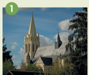
1 Abbaye de la Sainte-Trinité Clocher XII e Église abbatiale XI e -XV e