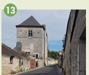
13 Tour Chevaleau Fin du XIII e