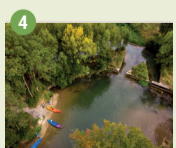
4 Canal de Beaulieu