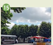
15 Mail Saint-Pierre