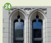
24 Couvent des Viantaises Bâtiment XV e