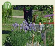
17 Jardin des Viantaises Ancien jardin du couvent des Viantaises