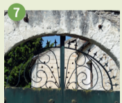
7 Enclos de Basile XV e