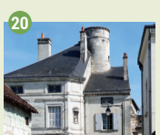
20 Villa Saint-Pierre XI e - XII e - XIX e