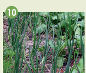
10 Le maraîchage Activité économique traditionnelle