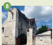
8 Léproserie XII e