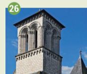
26 Église Saint-Laurent XI e - XV e