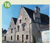
16 Vieille Poste XV e