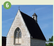
6 Chapelle Sainte-Barbe XV e