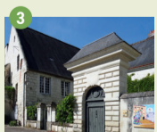
3 Maison du Prieur XIV e -XVII e