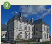
2 Mairie XIX e Bâtiments conventuels du XVII e