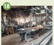
18 Moulin des Mécaniciens XVI e -XIX e