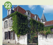
22 Hôtel Suzor XVII e