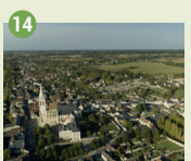
14 Vue sur Loches et Beaulieu