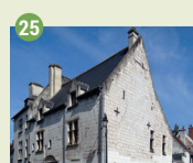
25 Maison du Pilon XV e