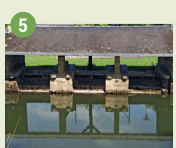
5 Lavoir du Pont Guénard XIX e