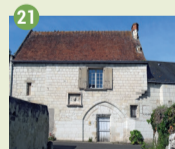
21 Maison d'Agnès Sorel XV e