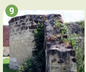
9 Mur d'enceinte XIV e - XV e