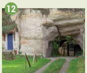
12 Les Grandes Caves Exploitées dès le XI e