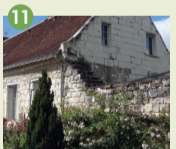
11 Ancien presbytère Gîte et gîte d'étape