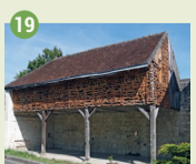
19 Halle des tanneurs XIX e