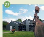
27 Jardins de l'Abbaye Site industriel XIX e -XXI e