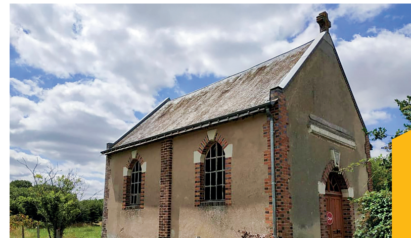
Le Temple Protestant