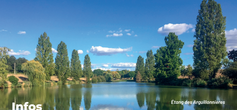
Étang des Arguillonnières