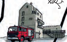
CENTRE DE FORMATION DU SDIS