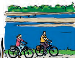
LA LOIRE À VÉLO