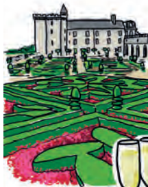
LE CHÂTEAU DE VILLANDRY ET SES JARDINS