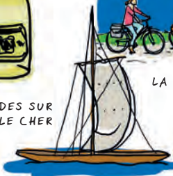
LES BALADES SUR LA LOIRE ET LE CHER