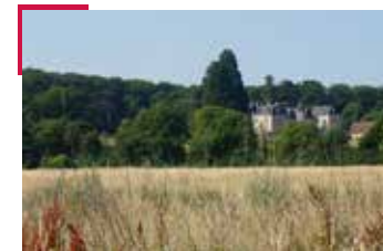
Château de Valesne