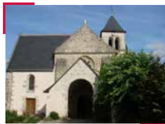
Eglise de Saché