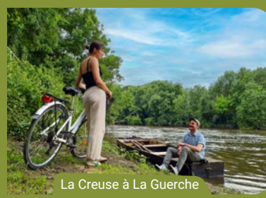
La Creuse à La Guerche