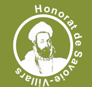
Honorat de Savoie-Villars

Aux mains des Savoie-Villars, la forteresse devient au XVI e siècle un logis confortable de style Renaissance. On doit à Honorat II Savoie Villars, cousin de François I er et proche des rois Henri II et Charles IX, la galerie du château ainsi que le Nymphée, autrefois situé dans le parc.