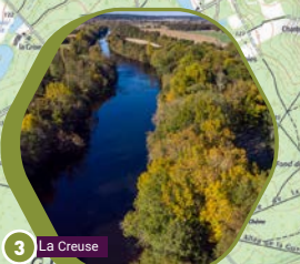
3 La Creuse

Balisage dans les deux sens Marking in both directions