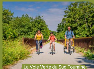
La Voie Verte du Sud Touraine