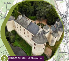
2 Château de La Guerche