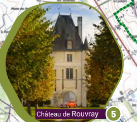
Château de Rouvray 5