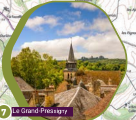
Le Grand-Pressigny 7

2 The village of La Guerche retains some of its winding streets which allow you to imagine the appearance of the village in medieval times, with the imposing castle at its heart. The castle which was rebuilt in the 15th century, occupies a strategic position between Touraine and Poitou. Access was by means of a drawbridge located between the towers of the entrance gatehouse on the south facade.