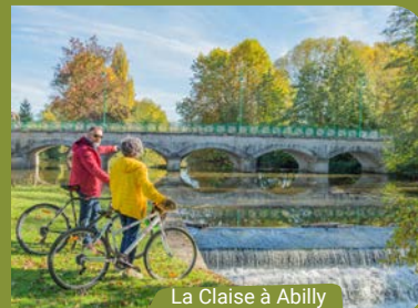
La Claise à Abilly